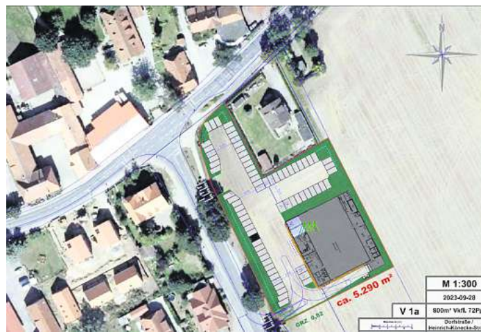
Mögliche Lage eines Nahversorgers in Isernhagen KB nach ursprünglichem ersten Planungsentwurf des Investors

ort auch immer, wird die Zukunft zeigen. Die Verwaltung, unter unserem aktuellen Bürgermeister, hat sich im Moment jedenfalls dagegen ausgesprochen.